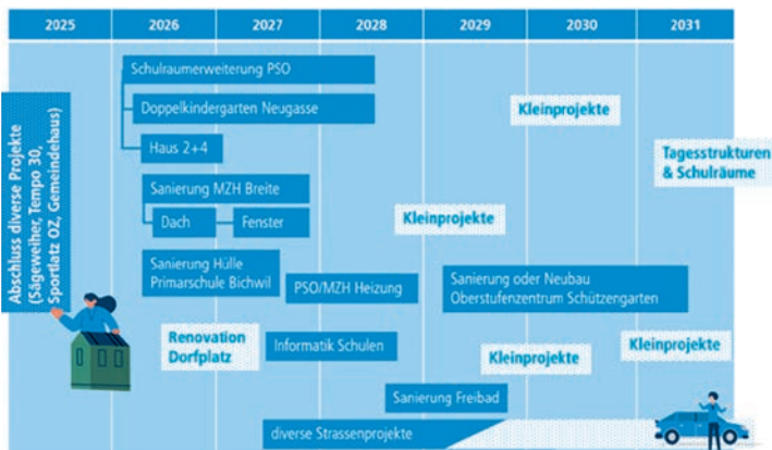
Gesamtüberblick über anstehende Investitionen der Gemeinde Oberuzwil (Stand Frühling 2025)

Für die unmittelbare Genehmigung durch die Bürgerschaft sind diverse Projekte anstehend (vgl. Grafik). Das Budget 2025 reicht für die Vorbereitung der Vorhaben nicht aus. Aus diesem Grund hat der Gemeinderat auf Antrag der Liegenschaftskommission Schulanlagen drei Nachtragskredite von total 82 000 Franken gesprochen. Damit ist die Projektierung der notwendigen Arbeiten für 2026 sichergestellt.