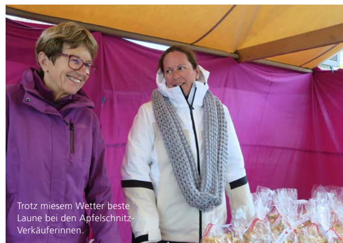
Trotz miesem Wetter beste Laune bei den Apfelschnitz-Verkäuferinnen.