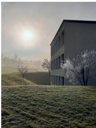
Titelbild: Kim Forrer Primarschule Bichwil