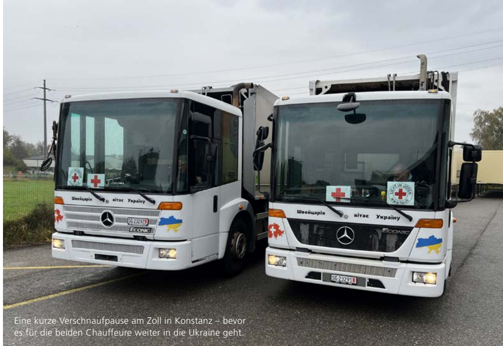
Eine kurze Verschnaufpause am Zoll in Konstanz – bevor es für die beiden Chauffeure weiter in die Ukraine geht.