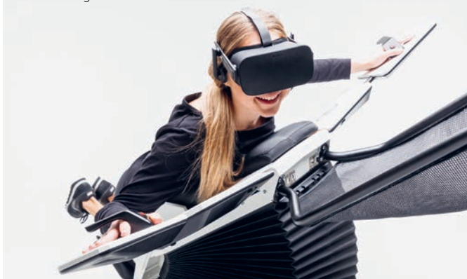
Insektenflugsimulator von BirdLife Schweiz

Mit dem Flugsimulator «Birdly Insects» macht der NVU auf zeitgemässe Art und Weise auf ein ernstes Thema aufmerksam: Die Insekten nehmen dramatisch ab, mit unbekannten Folgen für das ganze Ökosystem. Unter dem Motto «Abheben für die Biodiversität» informiert der NVU an seinem Stand über seine Aktivitäten und Möglichkeiten zur Erhaltung der Artenvielfalt im Siedlungsraum. Vom 19. bis 22. März 2025 heisst es im Foyer des Coop Uzwil «Abheben für die Biodiversität». Weitere Informationen finden Sie unter nvuzwil.ch .