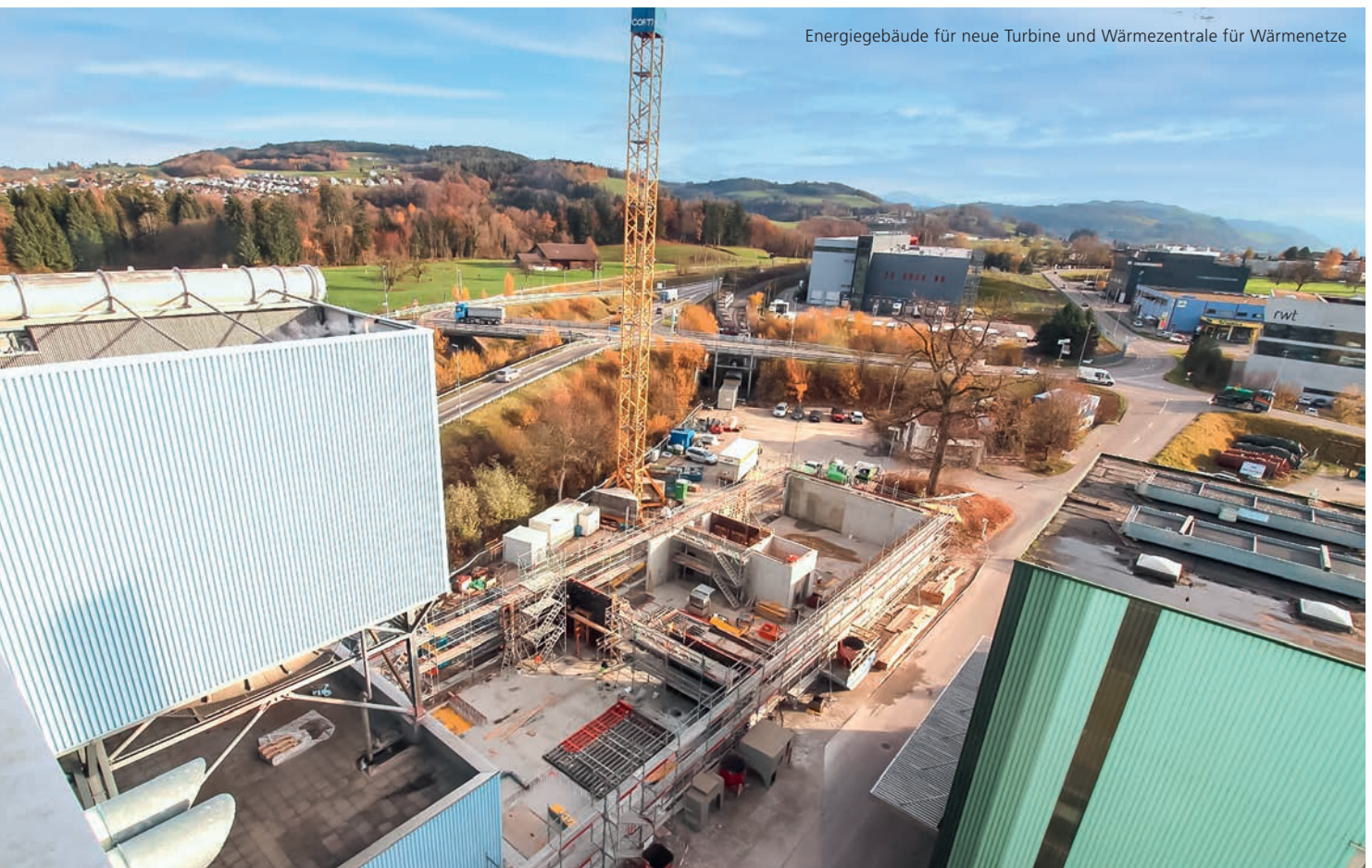
Energiegebäude für neue Turbine und Wärmezentrale für Wärmenetze

Im Rahmen des Bauprojekts wird für die Unterbringung der künftigen E-Fahrzeugflotte ebenfalls eine Tiefgarage mit entsprechender Ladeinfrastruktur gebaut werden. Mit dem Bau der Tiefgarage mit zwei Etagen, welche zwischen dem Energiepark und dem alten Sortierwerk zu liegen kommt, soll im kommenden Februar begonnen werden und rund ein Jahr in Anspruch nehmen. In den kommenden Jahren wird der ZAB seine multifunktio-