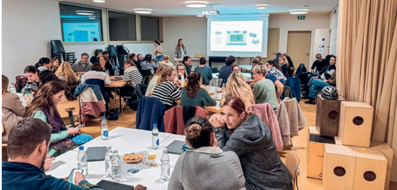
4. KLASSE PRIMARSCHULE OBERUZWIL UND BICHWIL