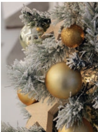
Titelbild: Lea Eberle

Inserate- und Redaktionsschluss 9. Januar 2026, 8.30 Uhr