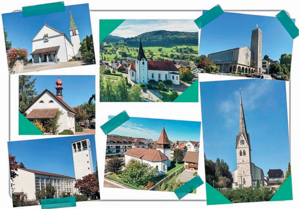
Die Seelsorgeeinheit Uzwil und Umgebung wächst auch administrativ zusammen.